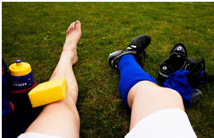
Yep... Ik ben erg goed in voetbal...