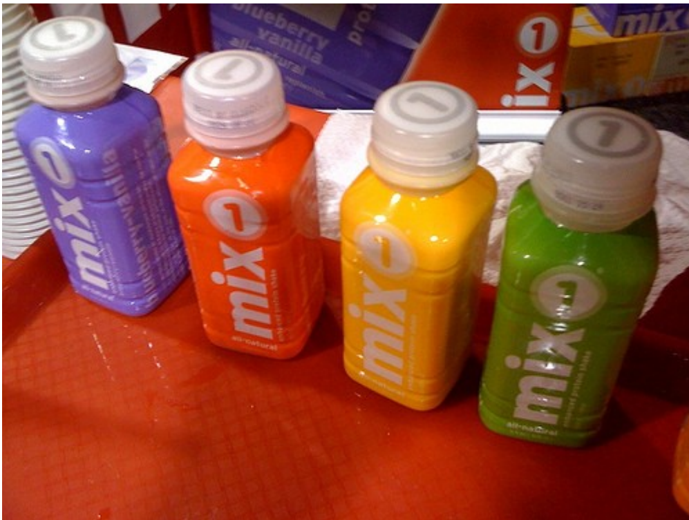
MIX Protein Drink

La nutrition du sportif : du loisir à la compétition : santé, bien-être et performance / Patrick Bacquaert,... Frédéric Maton,...- Magny-les-Hameaux : Chiron, impr. 2009.- 1 vol. (413 p.) : ill. en coul., tabl., couv. ill. en coul. ; 24 cm.- (Sport et santé) ISBN 978-2-7027-1286-3