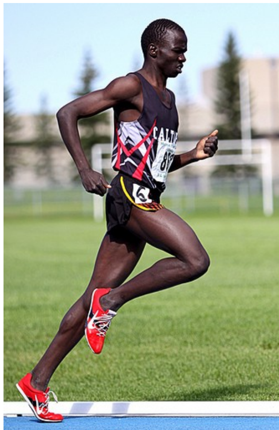
2011 Sherwood Park Classic

http://www.inpes.sante.fr/jp/cr/pdf/2006/jp2006_session_6.pdf