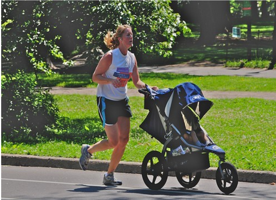
Jogging in the park...