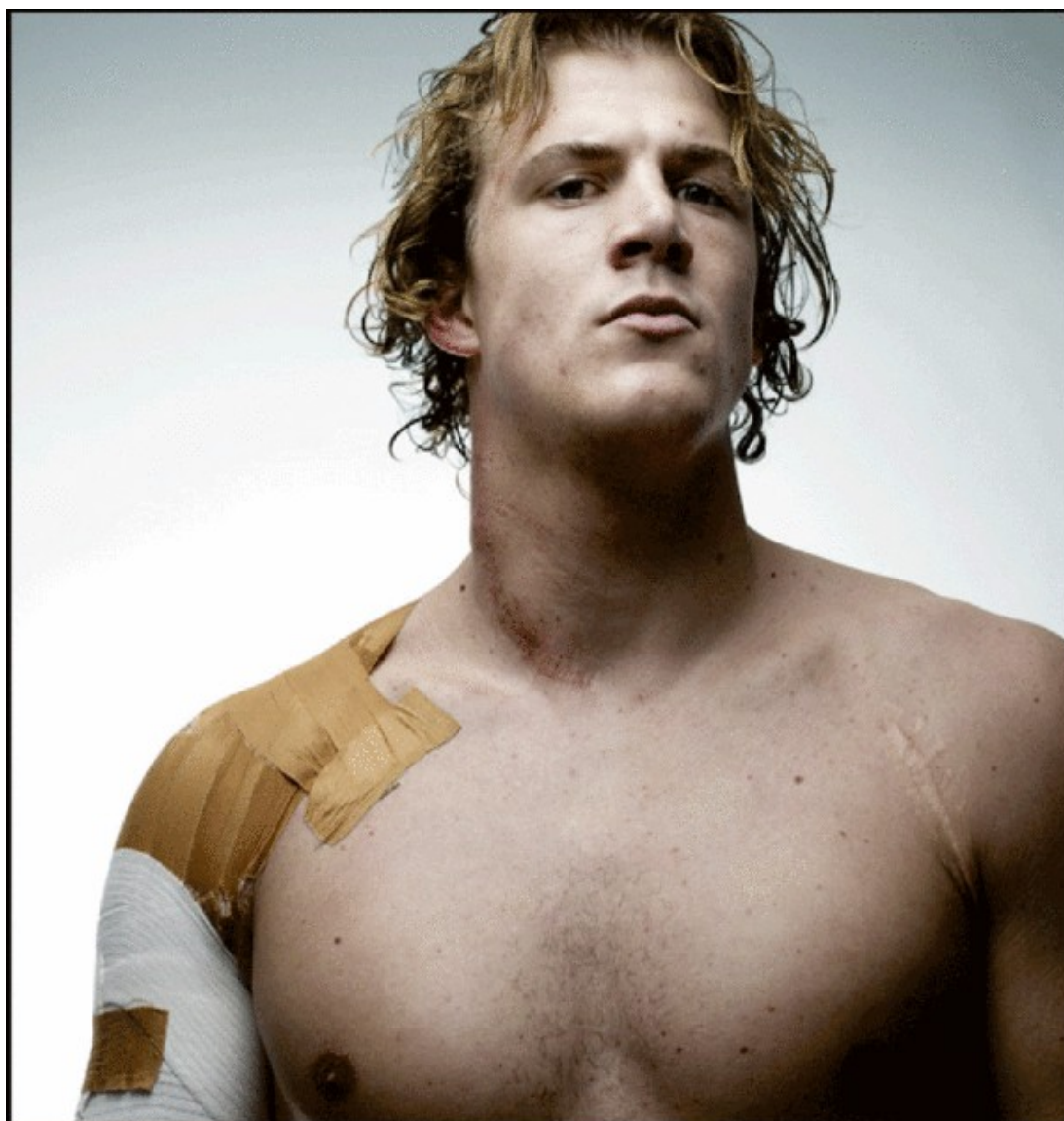
Aurélien Rougerie - © Sorties de match Par Denis Rouvre